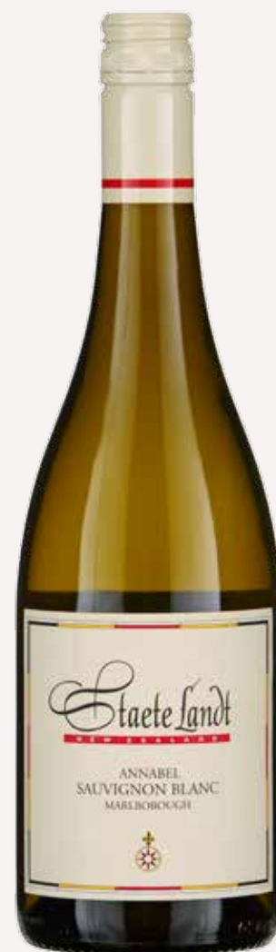
PRODUCTIE EN TEKST ELLEN DEKKERS